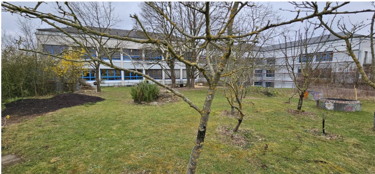
Schulgarten mit Obstbäumen, kleineren Hochbeeten, Obstbäumen, Kräuterspirale und Ackerfläche

Die vorhandenen Bäume sollen erhalten bleiben. Das Dachflächenwasser des vorderen Gebäudeteils soll in eine Zisterne oder mehrere IBC-Behälter geführt werden, damit die Bewässerung des Schulgartens überwiegend mit Niederschlagswasser erfolgen kann. Die Schulgartenfläche soll so angelegt werden, dass die Wiesenbereiche zwischen den Arbeitsbereichen durch den Schulhausmeister gemäht werden können.