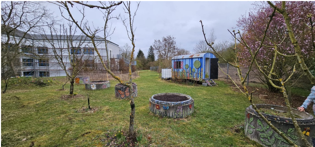
Schulgarten mit Obstbäumen, kleineren Hochbeeten und einem Bauwagen