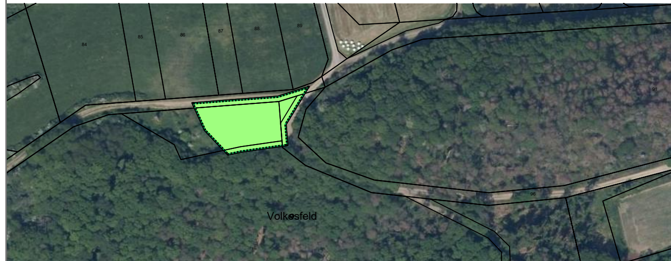
Lage der externen Ausgleichsfläche (Maßstab 1:1.000), Gemarkung Volkesfeld, Flur 2, Flurstück 96 und 97, jeweils teilweise mit 1.600 qm

HINWEIS: Die vorderen, seitlichen und hinteren Abstände von Bauvorhaben können außer durch die Begrenzung der überbaubaren Flächen (Baugrenzen), zusätzlich durch die Bestimmungen des § 8 LBauO (RLP) eingeschränkt werden.